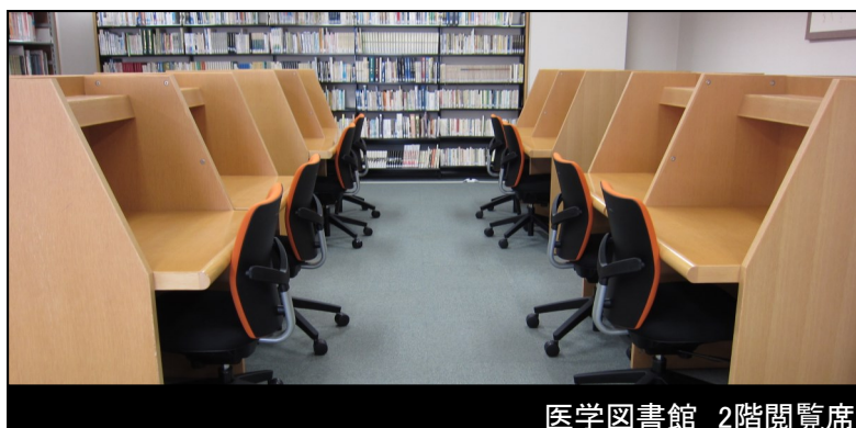
医学図書館 2階閲覧席