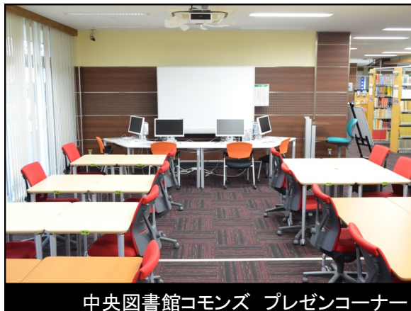
中央図書館 commons プレゼンコーナー