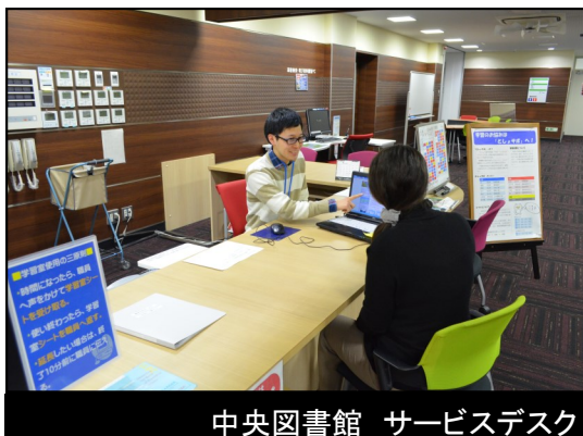
中央図書館 サービスデスク